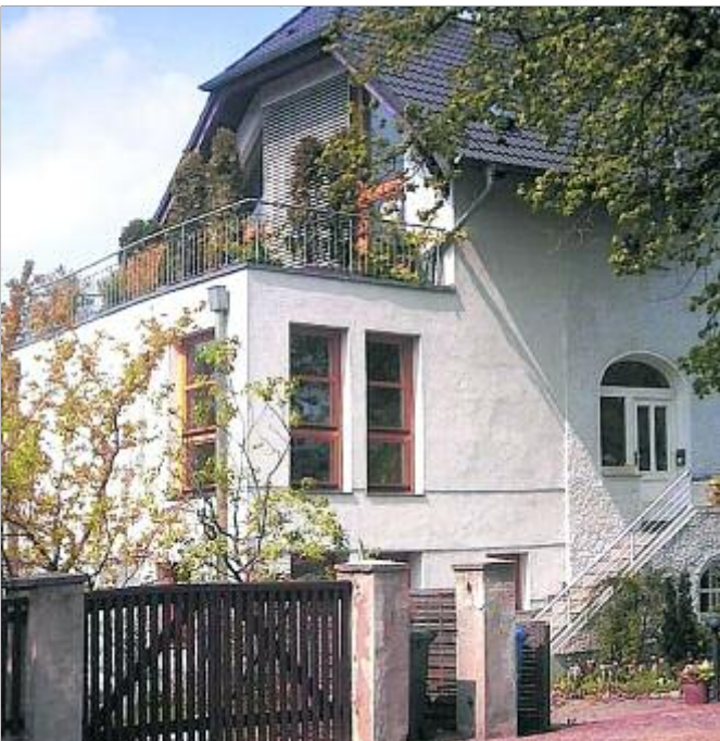
Ein modernisiertes und hochdichtes Gebäude muss gut belüftet werden.

Etwa alle zwei Stunden sollte die verbrauchte, feuchte Raumluft komplett ausgetauscht werden. In einem normalen Haushalt genügt es in der Regel, regelmäßig durch weites Öffnen der Fenster stoßzulüften. „Bei Niedrigenergiehäusern überlässt man den Luftaustausch dagegen am besten einer Lüftungsanlage, bei Passiv- oder Niedrigenergiehäusern ist eine geregelte Lüftung, am besten mit Wärmerückgewinnung, sogar unabdingbar“, betont Diplom-Ingenieur