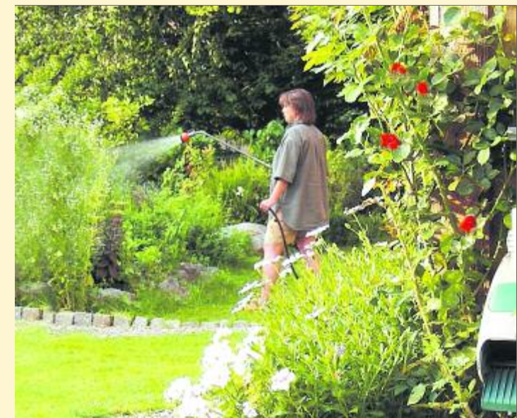
Mit schönen Stauden und Blüten wird belohnt, wer jetzt im Garten aktiv wird.

Als Sichtschutz oder zur Strukturierung der Fläche eignen sich auch Sträucher, die als Solitär, in lockeren Gruppen oder als Hecke gepflanzt werden können. Die immergrünen Gehölzen ist groß, nach der Pflanzung reichlich gedüngt werden. Im ersten Jahr was dabei ist. Beim Kauf immer den Strauch bei Trockenheit immer mal wässern. Ist er angeordnet gut durchwurzelten Pflanzen wachsen und hat eine gewisse Container achten. Das Pflanzloch sollte doppelt so groß wie der Wurzelballen ausgehoben und reichend.