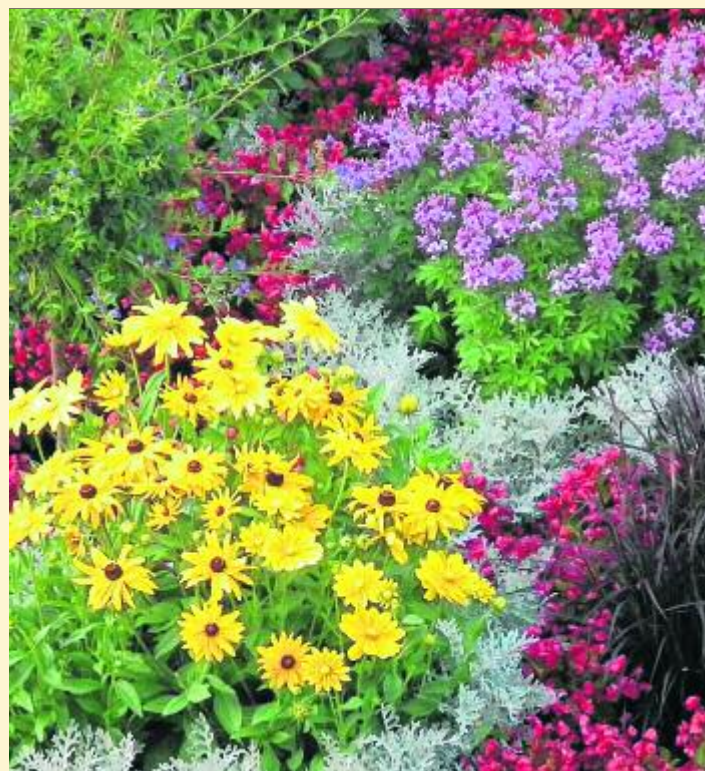
Die Blütenfarben sollten miteinander harmonisieren – das ist aber Geschmackssache.

Gräser sind evolutionstechnisch betrachtet eine noch relativ junge Pflanzengruppe, dennoch sind sie weltweit verbreitet und dabei erstaunlich vielseitig. Ob sonnig oder schattig, trocken oder feucht, für jeden Standort gibt es passende Gräserarten, wobei die meisten einen sonnigen Standort bevorzugen. Im Gartenbereich werden sie unter anderem auch deshalb immer beliebter. Gräser wirken durch ihr Laub und ihre Blütenstände, die dem Garten ein gewisses romantisches Flair verleihen. Ob am Teich, als Bepflanzung in der Blumenrabatte, als hohe immergrüne Hecke oder als imposanter Solitär, Ziergräser lassen sich vielseitig einsetzen und man sollte auf sie im Garten nicht verzichten.