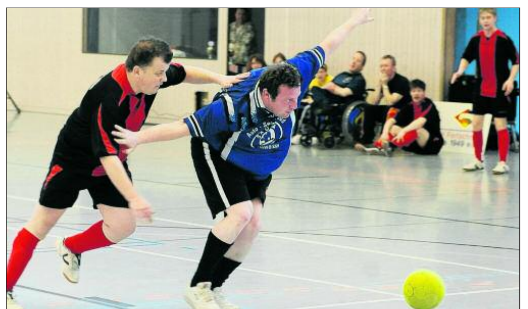
Höhepunkt beim Sportfest war ein Fußballspiel, das die Altherren des TSV Fortschritt und die Männer der Behindertenwerkstatt mit 5:5 bestritten.