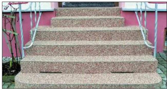
Nachher: Nach der Profi-Sanierung ist die Treppe ein richtiger Blickfang.

dauerhaft verhindert und eine gute Wasserdampfdurchlässigkeit bietet. Zudem sind die Beläge UV- und witterungsbeständig.