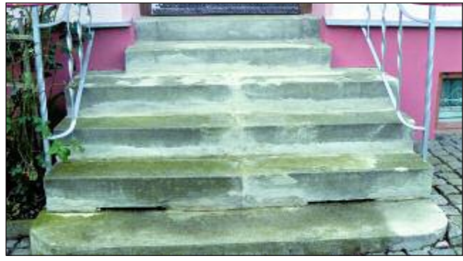
Vorher: Die Treppe aus Sandstein in ihrem Zustand vor der „Behandlung“.

Außentreppe, Terrassen und Balkone werden nicht nur Tag für Tag mit Füßen getreten, sie sind auch permanent Wind und Wetter ausgesetzt. Und so kann es im Laufe der Zeit zu undichten Stellen an Fliesen oder Platten beziehungsweise den Fugen kommen. Erste Anzeichen für solche Schäden sind sogenannte Ausblühungen. Wasser dringt über schadhafte Fugen unter die Nuttschicht. Bei Erwärmung steigt es über den Mörtel an die Oberfläche. Kalkrückstände bleiben sichtbar. Bei Frost verwandelt sich das Wasser in den Poren zu Eis. Durch den entstehenden Druck werden die Risse verursacht. Folgen sind undichte Anschlussbereiche und die Zerstörung der Bausubstanz. Um derartige Schäden zu vermeiden, ist eine Abdichtung erforderlich. Flüssigkunststoffe sind dafür bestens geeignet. Beschichtungen auf Polyurethanharzbasis gewährleisten eine Rissüberbrückung von bis zu zwei Millimetern und sind bei Frost sowie Wärme elastisch und flexibel. Dadurch erreicht man eine nahtlose Abdichtung, die das Eindringen von Feuchtigkeit zuverlässig und