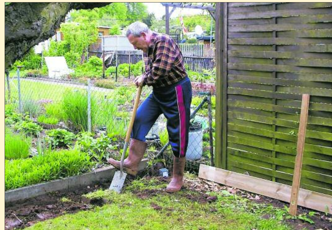
Mit den ersten Sonnenstrahlen sprießen leider auch die Unkräuter, die sich jetzt noch relativ leicht und schnell entfernen lassen. Anschließend sollte die Gartenerde aufgelockert und mit etwas reifem Kompost verbessert werden.

Frühlingserwachen nutzen Mit den ersten Sonnenstrahlen sprießen leider auch die Unkräuter, die sich jetzt noch relativ leicht und schnell entfernen lassen. Anschließend sollte die Gartenerde aufgelockert und mit etwas reifem Kompost verbessert werden. Das tut den Pflanzen gut und gibt ihnen eine optimale Starthilfe. Auch der Rasen erwacht langsam zu neuem Leben. Mit dem Mähen kann man sich zwar noch etwas Zeit lassen, dennoch dankt es das Grün, wenn es gründlich abgehackt und verteilt wird. Zudem kann jetzt der Winterschutz von den Rosen entfernt werden. Bei dieser Gelegenheit lohnt es, die Erde um die Rosenstöcke aufzulockern und Dünger oder Kompost leicht einzuarbeiten, damit die Pflanzen ausreichend Nährstoffe für den Neuaustrieb erhalten.